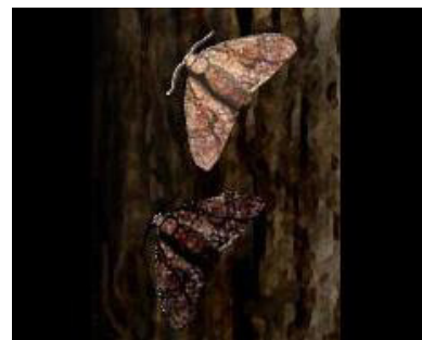
Tá duaithníocht maith ag an brocóg dubh sóite i gcoinne an crann beithe dubh