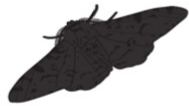
An brocóg meathbhán