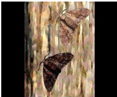
Na brocóga meathbhán le duaithníocht maith i gcoinne an crann beithe meathbhán

In áiteanna tionsclaíoch bhí truailliú san aer a chur smúit dubh ar na crainn. De bharr seo bhí duaithníocht ag na brocóga dubh anois, mar sin bhí na brocóga meathbhán i mbaol. Thug é seo buntáiste dos na brocóga dubh, agus bhí níos mó seans ann go mhairfidh siad chun atáirgeadh a dhéanamh. Thar ama tháinig méadú ar na éagsúlacht dubh agus laghdú ar an méid brocóga meathbhán in áiteanna uirbeach.