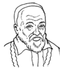
Girolamo Fabrici (Fabricius).

Thuas tá roinnt eolaí ainmnithe a bhí ag obair ar smaointí faoin córas imshruthaithe. Déan taighde ar cad a d'fhoghlaim said. Taispeáin an t-eolas in amlíne, ag tabhairt na hainmneacha in órd ama agus liostaigh a chuid smaointí. Úsáid an eagrú thíos.